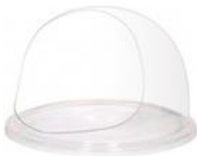
Рис2. Защитный колпак