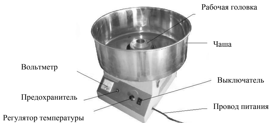
Рис.1 Основные элементы оборудования