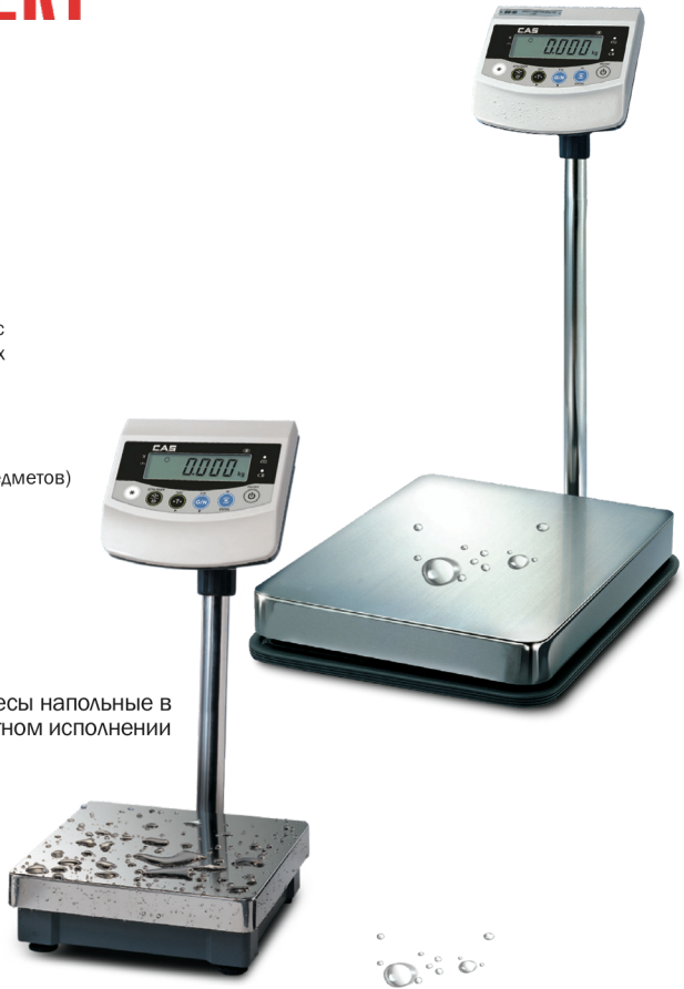
Весы напольные в пылеводозащитном исполнении

Весы (исполнение R, RB) могут работать от аккумуляторных батарей типоразмера AA