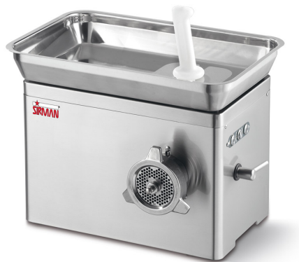
Sirman Мясорубки , model TC 32 Nevada :

Sirman Spa Viale dell'Industria 9/11 35010 PIEVE DI CURTAROLO (PD), Italy Tel./Fax. +39 049 9698666 / +39 049 9698688 email: info@sirman.com