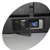
Крышка защитного термостата