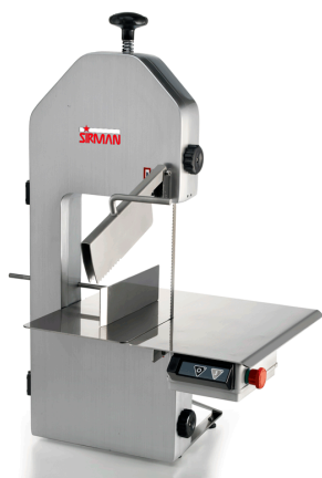
Sirman Пилы для резки мяса , model SO 1840 F3 :

Sirman Spa Viale dell'Industria 9/11 35010 PIEVE DI CURTAROLO (PD), Italy Tel./Fax. +39 049 9698666 / +39 049 9698688 email: info@sirman.com