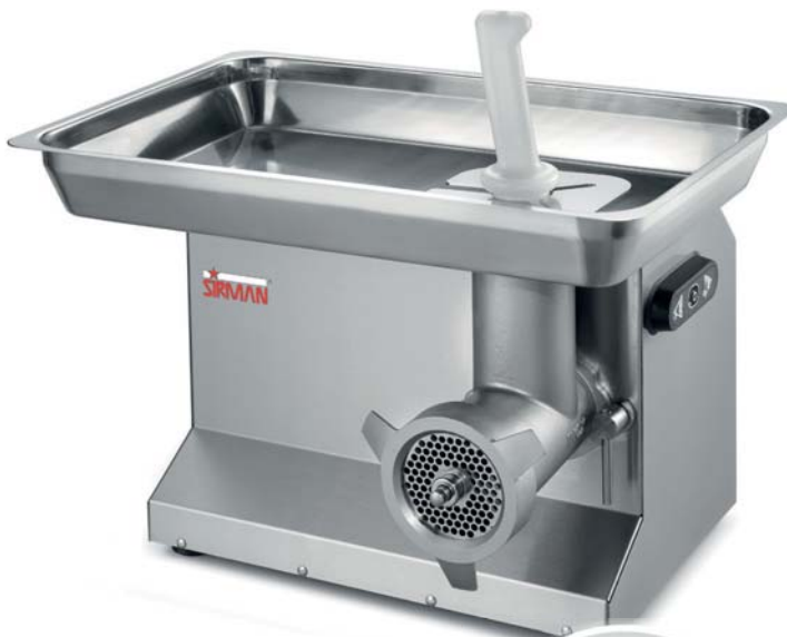
TC 32 COLORADO