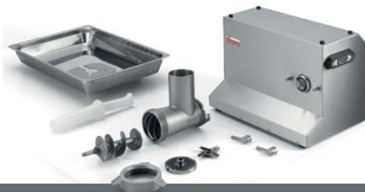
TC 22 COLORADO con hamburgertrice