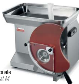
Format M opzionale Optional Format M