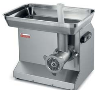
TC 22 COLORADO