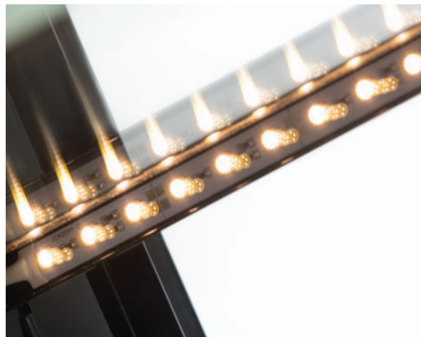
LED-подсветка экспозиции: полок и внутреннего пространства