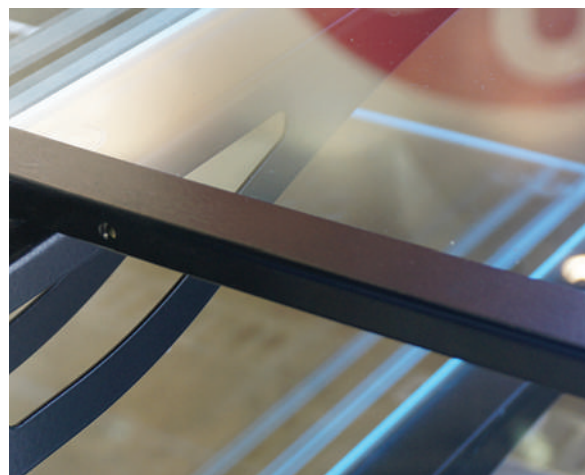
Возможность регулирования угла наклона полки