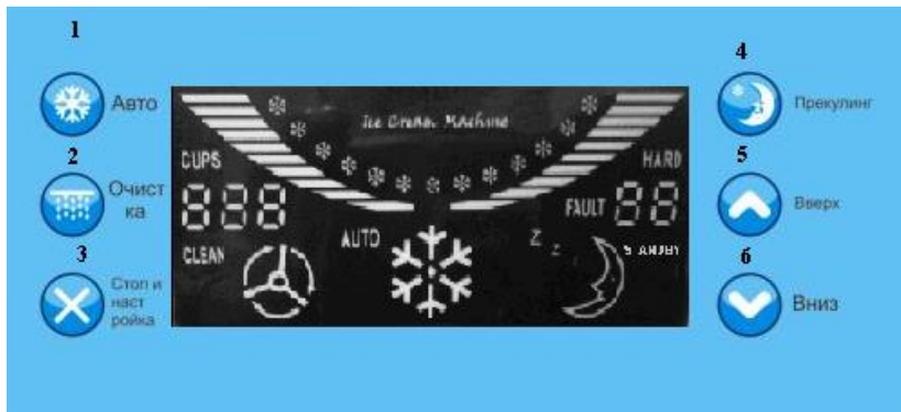
Рис. 1 Дисплей панели управления. Отображения основных функций. Кнопки управления.