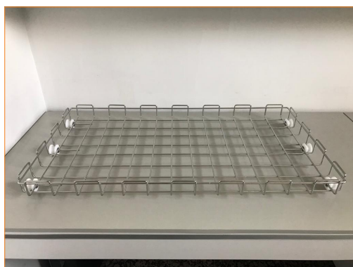
Универсальная кассета 206709 (615x1150 мм)