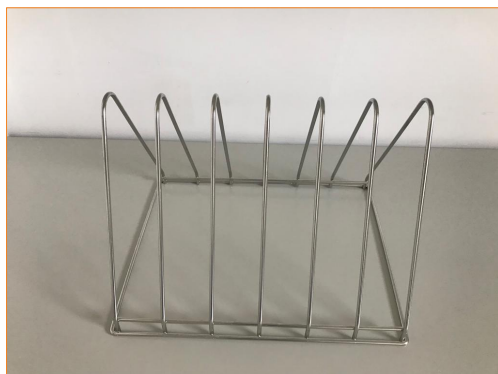
Вставка для подносов и противней TR0926

Кассеты 1 универсальная кассета, 1 вставка для пекарских листов Комплект подключения 1 шланг для подачи воды