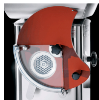
Optional patty former