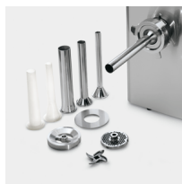
Optional stuffer kit