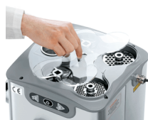
Compartment for knives and plates