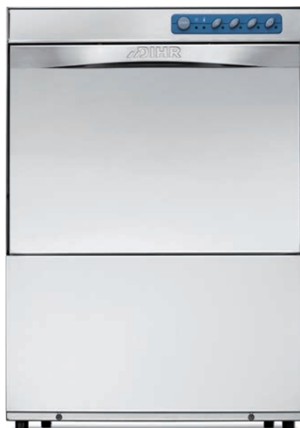
GS 50 - GS 50 T