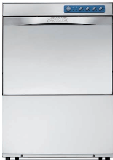
GS 50 ECO