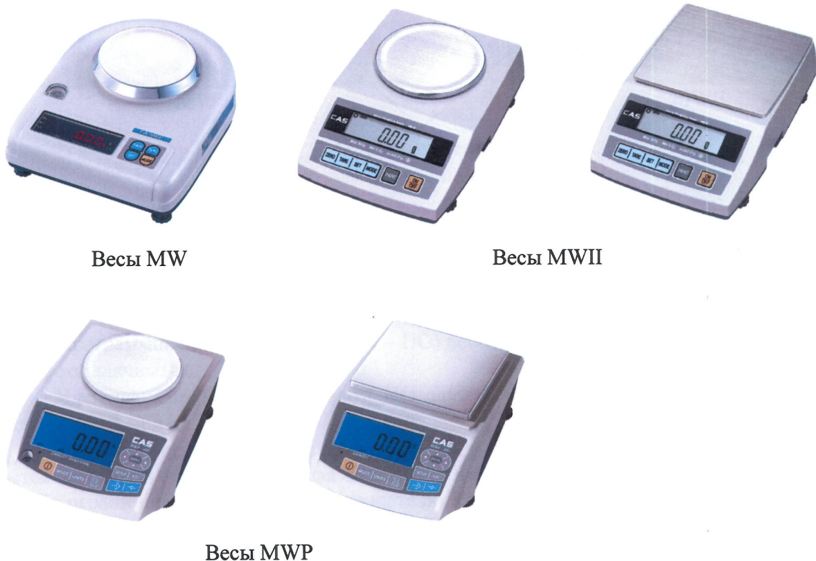
Рисунок 1 – Общий вид весов MW, MWII, MWP

Общий вид весов представлен на рисунке 1.