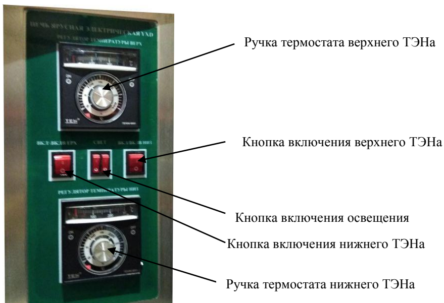
Рис3 – обозначения блока управления печью.

3. Установите определенную температуру в печи: отрегулируйте ручку термостата до заданной температуры согласно требованиям к выпечке.