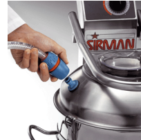
Fast connection/remove of water entry