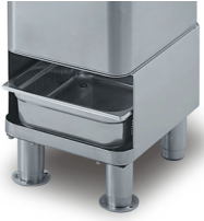
Optional trestle with sieve