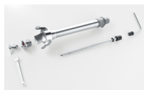
Removable knives and shaft