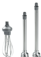
Shafts and Whisk