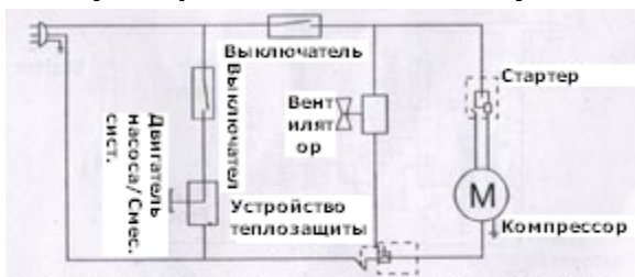
Принципиальная электросхема дозатора-сокоохладителя с одинарным контейнером для напитков JD-1.