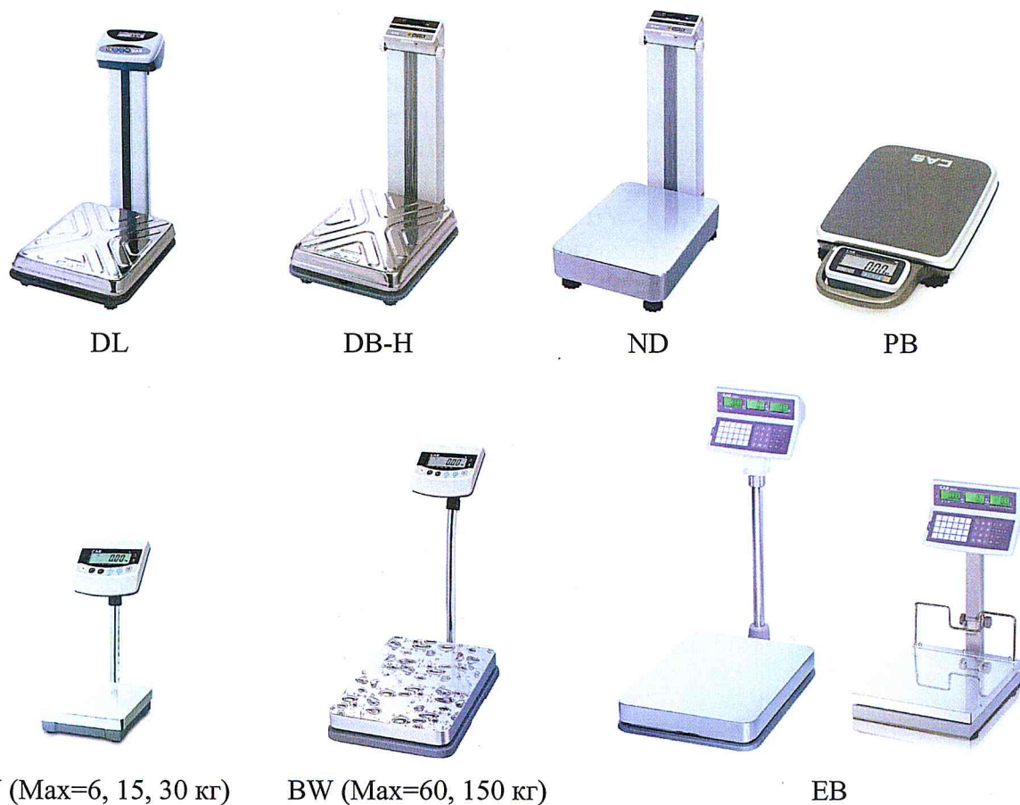
Рисунок 1 - Общий вид весов

Общий вид весов представлен на рисунке 1.