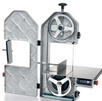
SO 1840 F3