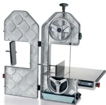
SO 1650 F3