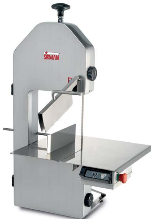
SO 1840 F3