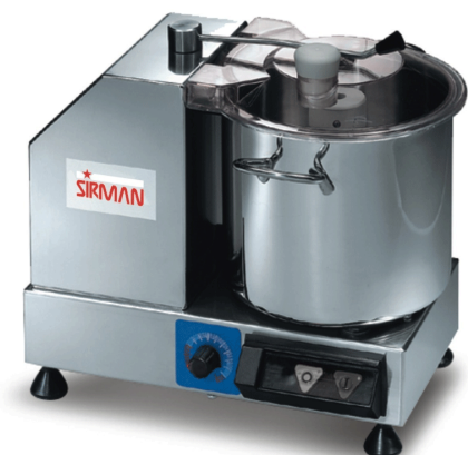
Sirman Куттеры , model Cutter C6 :

Sirman Spa Viale dell'Industria 9/11 35010 PIEVE DI CURTAROLO (PD), Italy Tel./Fax. +39 049 9698666 / +39 049 9698688 email: info@sirman.com