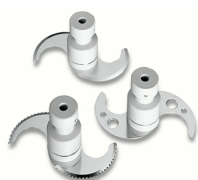
Shaft with knives to mix dough