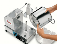
S/Steel 18/10 bowl with thermal diffusor bottom, easy to empty and to clean