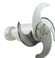
Shaft with knives for pesto sauce