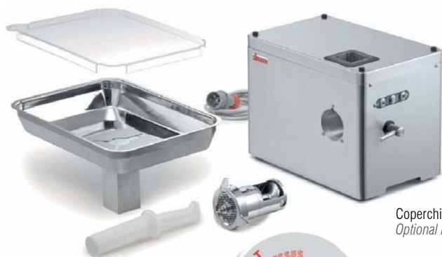
Coperchio opzionale Optional lid