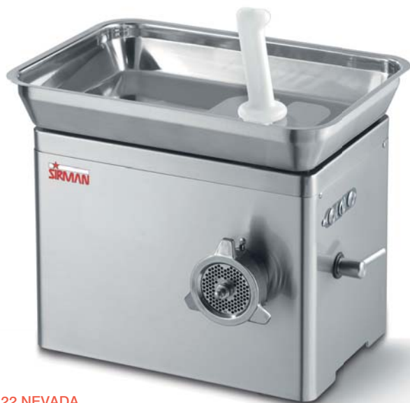
TC 22 NEVADA