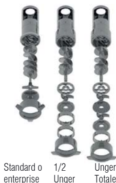
Standard o enterprise 1/2 Unger Unger Totale