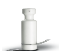
Shaft with knives to mix dough