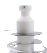
Shaft with knives for pesto sauce