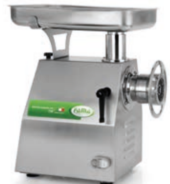
TI22R UNGER TOTALE INOX