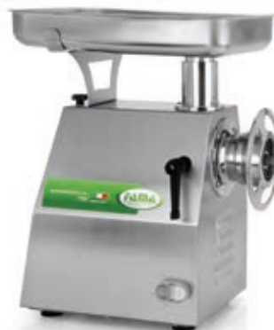
TI22R 1/2 UNGER INOX