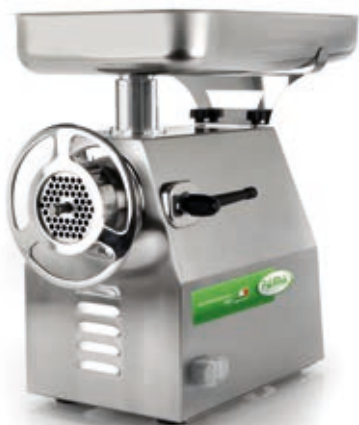
TI32RS UNGER TOTALE INOX