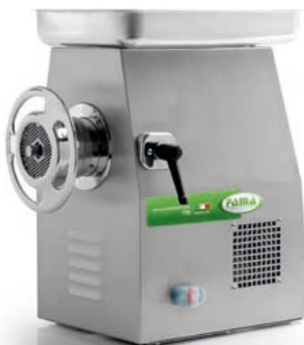
TI32R UNGER TOTALE INOX