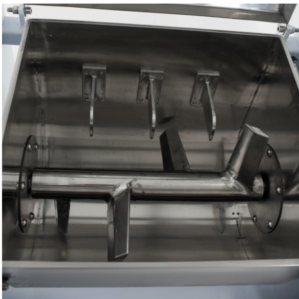
Месильный орган - J