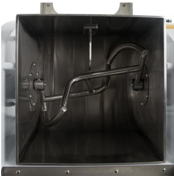
Месильный орган - H