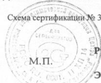
Схема сертификации № 3. Маркирование продукции знаком соответствия производится по ГОСТ Р 50460-92.